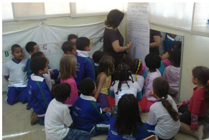
Foto 4 - Elaboração de texto coletivo

É importante salientar que pudemos visitar o formigueiro (CDCC), o que contribuiu muito para o entendimento das crianças após a observação do formigueiro por dentro, (“ao vivo”).