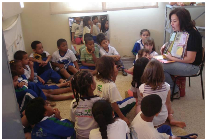
Foto 3 - Leitura de textos informativos

E assim foi feito. Também observaram a formiga no microscópio para que visualizassem os mínimos detalhes do corpo das mesmas.