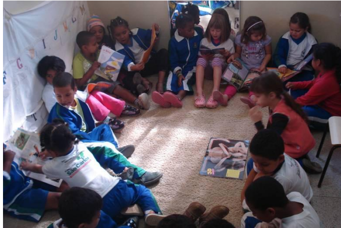
Foto 2 - Pesquisando em livros e revistas

A professora também perguntou aos alunos onde poderiam encontrar mais coisas sobre o assunto e eles citaram livros, revistas e computador. E então, providenciaram tais materiais que foram disponibilizados aos alunos a realização da pesquisa bibliográfica.