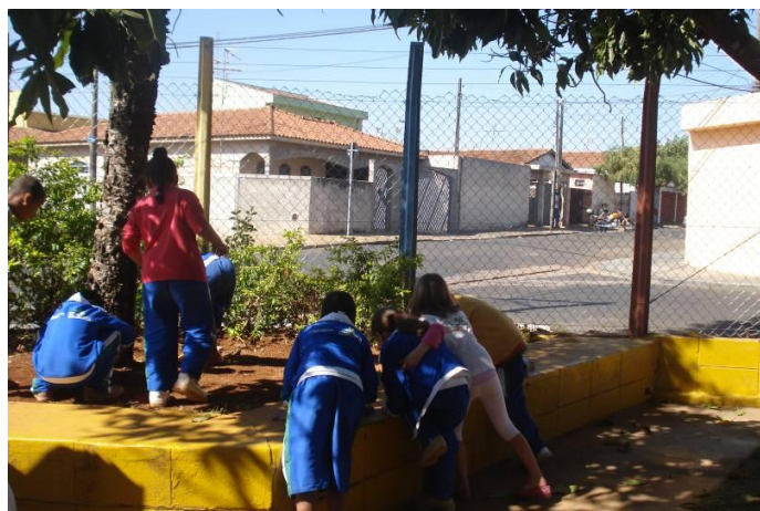
Foto 1 - Pesquisa a campo

A professora sugeriu que a partir daquele momento as observassem atentamente e então iniciaram o trabalho saindo a campo nas dependências da escola, a procura de formigas, mas ressaltou para que apenas observassem e não tocassem nelas, nem no formigueiro, mantendo respeito.